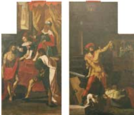
Seitenflügel der alten Orgel (zurückgekauft im Jahre 1995)

Im Jahre 1808 ersetzte man diese Orgel durch eine aus der profanierten Wallfahrtskirche Birnau am Bodensee erworbene Orgel, die ihrerseits 1905 durch ein pneumatisches Werk der Orgelbaufirma Kuhn in Männedorf ersetzt wurde. Erst von die-