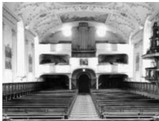
Orgel bis 1960

ser Orgel existiert eine Foto. Sie hatte ein an den Klassizismus anklingendes schmales Gehäuse und stand auf der Mittelestrade der 1960 abgebrochenen Doppelempore.